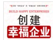
企业的追求超越盈利