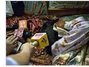
赤裸裸的媒体暴力