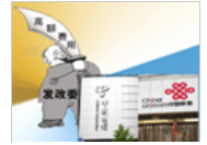
反垄断何时能落到实处